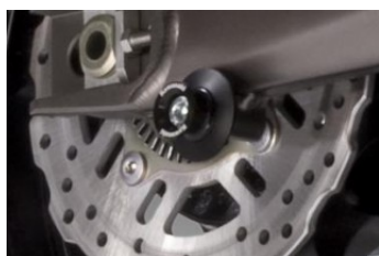
КОМПЛЕКТ ОПОРНЫХ РОЛИКОВ