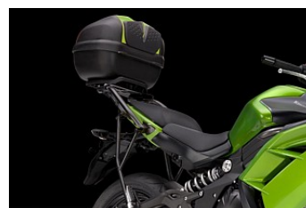
КРЕПЛЕНИЕ ДЛЯ ЦЕНТРАЛЬНОГО КОФРА