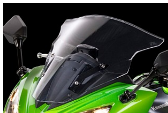
Усиленная защита от ветра