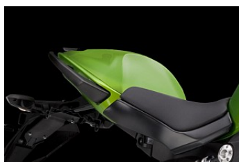
НАКЛАДКА НА СИДЕНИЕ