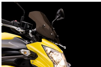
ТОНИРОВАННОЕ ВЕТРОВОЕ СТЕКЛО