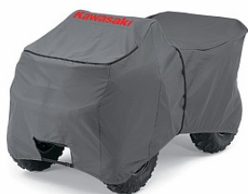
ЧЕХОЛ ДЛЯ КВАДРОЦИКЛА (БОЛЬШОЙ)