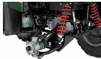
Модифицированные настройки подвески