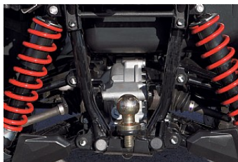
Независимая задняя подвеска (IRS) с двойным поперечным рычагом