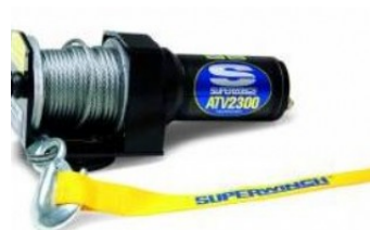
ЛЕБЁДКА SUPERWINCH ATV2300 (2300LB/1043 КГ)