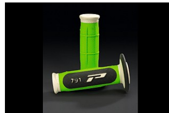
РУЧКИ PROGRIP ТРОЙНОЙ ПЛОТНОСТИ