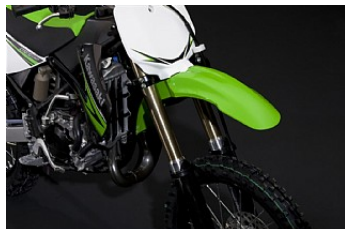
ПЕРЕДНИЙ ЩИТОК UFO

На эти детали не распространяются условия гарантии Kawasaki