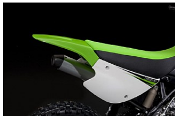
ЗАДНИЙ ЩИТОК UFO