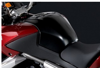
19-литровый топливный бак