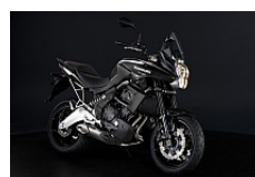
Черный (Metallic Spark Black)