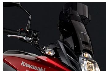
РЕГУЛИРУЕМОЕ ВЕТРОВОЕ СТЕКЛО VARIO