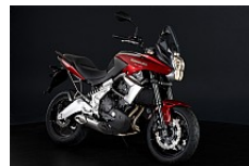
Красный (Metallic Imperial Red)