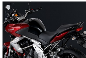
Высокая прямая посадка