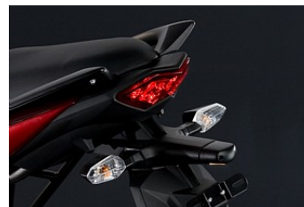
Светодиодный задний фонарь