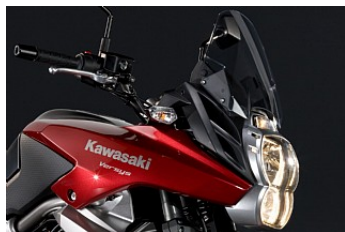
Новый внешний вид