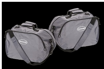
КОМПЛЕКТ ВНУТРЕННИХ СУМОК (2x34л)