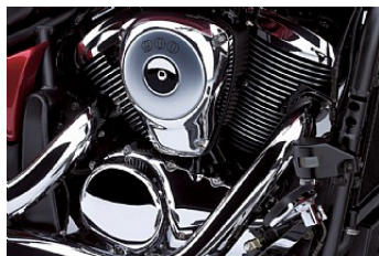
Хромированные крышки двигателя