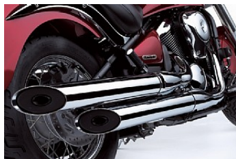
Двойные глушители с косым срезом