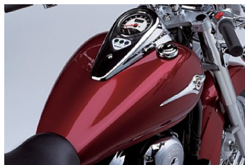
Мощный и привлекательный