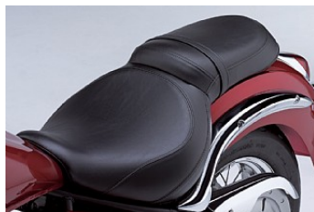
Комфортный и эргономичный