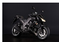
Черный (Ebony / Flat Ebony)