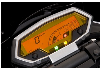
Новая регулируемая панель приборов