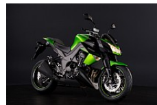
Зеленый (Candy Lime Green / Ebony)