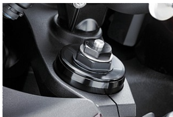
Полностью регулируемая передняя вилка