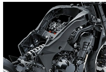
Полностью обновленная алюминиевая сдвоенная рама