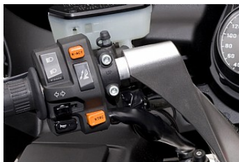
Активная тормозная система второго поколения K-ACT