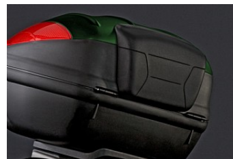
ПОДУШКА СПИНКИ ЦЕНТРАЛЬНОГО КОФРА 47 Л