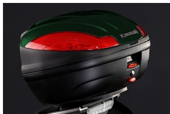
БОЛЬШОЙ КОФР (47л)