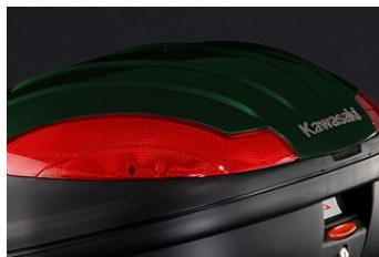
НАКЛАДКА ДЛЯ ЦЕНТРАЛЬНОГО КОФРА 47 Л