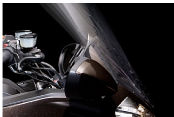
Более высокое и широкое регулируемое ветровое стекло