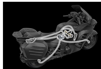
Антипробуксовочная система Kawasaki Traction Control (KTRC)