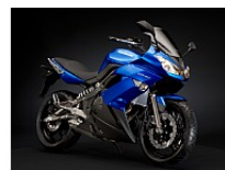
Синий (Candy Plasma Blue)