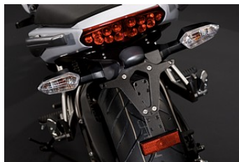
КРЕПЛЕНИЕ ДЛЯ НОМЕРНОГО ЗНАКА