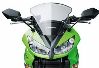
Двойная передняя фара