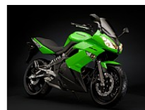
Зеленый (Lime Green)