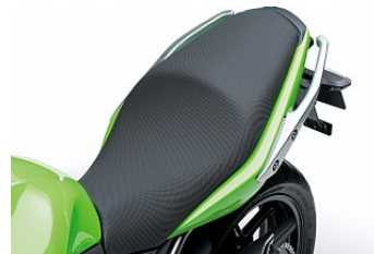
Эргономичность для водителя