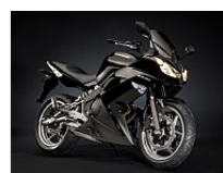
Черный (Metallic Diablo Black)