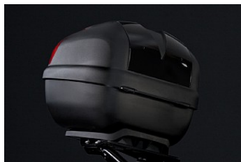
ЦЕНТРАЛЬНЫЙ КОФР 30 Л