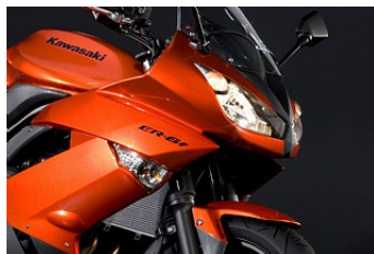
Обтекатель в стиле суперспорт