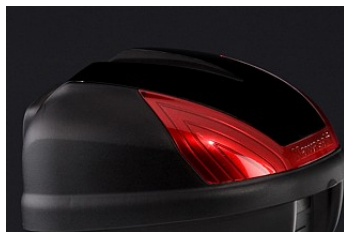
НАКЛАДКА ДЛЯ ЦЕНТРАЛЬНОГО КОФРА 30 Л