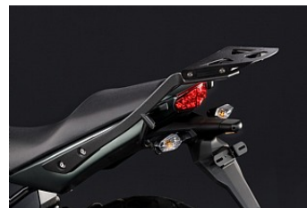
КРЕПЛЕНИЕ ЦЕНТРАЛЬНОГО КОФРА