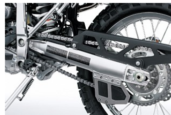
Рама и маятник