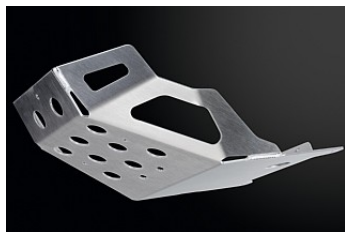
АЛЮМИНИЕВАЯ ЗАЩИТА КАРТЕРА