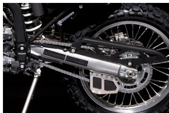
Рама и маятник