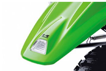
Сверхкомпактный и экономичный задний фонарь на светодиодах