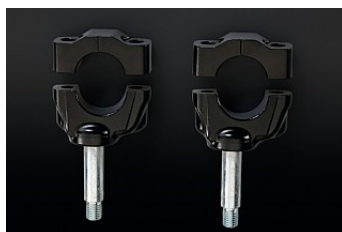
КРОНШТЕЙНЫ КРЕПЛЕНИЯ РУЛЯ