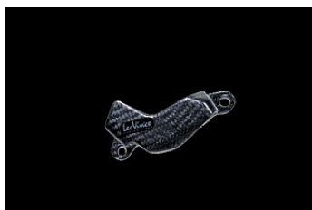
Защита суппорта (карбон)

На эти детали не распространяются условия гарантии Kawasaki