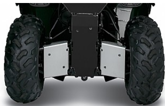
ЗАДНЯЯ ЗАЩИТА РАМЫ