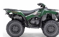
Зеленый (Woodman Green)

Акцент производителя на спортивные и эксплуатационные качества данной модели отличают ее от других вездеходов флагманского типа. Наличие независимой задней подвески не значит, что KVF750 4x4 позволит водителю просто сидеть и наслаждаться отдыхом; контроль над вездеходом находится, прежде всего, в руках водителя. Конструкторский подход "активный водитель" характерен для всех вездеходов Kawasaki. Вездеход обладает отличной управляемостью и прекрасным откликом на действия водителя.