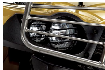
ЗАЩИТА ПЕРЕДНИХ ФАР