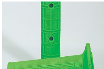
ФИРМЕННЫЕ ЗЕЛЕНЫЕ РУЧКИ KAWASAKI

На эти детали не распространяются условия гарантии Kawasaki