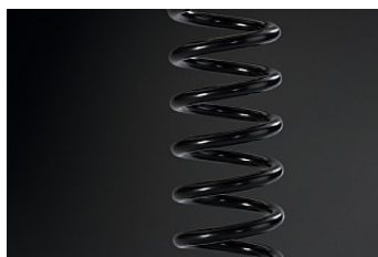
ЗАДНИЙ ПРУЖИННЫЙ АМОРТИЗАТОР