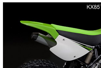
ЗАДНИЙ ЩИТОК UFO