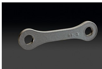
АДАПТЕР ЗАДНЕЙ ПОДВЕСКИ

На эти детали не распространяются условия гарантии Kawasaki