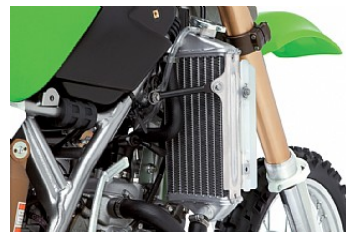
Холодный взгляд на вещи