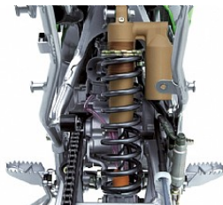
Не выбывать из борьбы