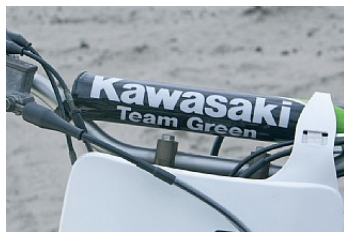
МЯГКАЯ ЗАЩИТА НА РУЛЬ