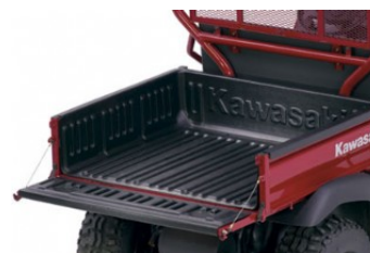
ПЛАСТИКОВОЕ ПОКРЫТИЕ КУЗОВА Mule 600/610