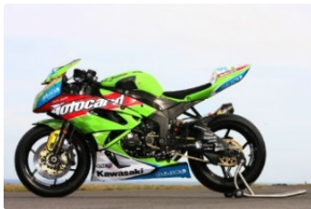
КОМПЛЕКТ НАКЛЕЕК WORLD SUPERSPORT