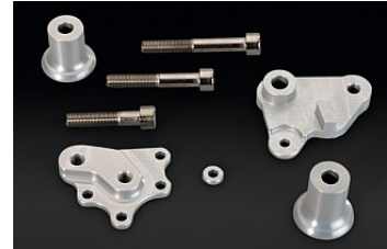
КРОНШТЕЙНЫ ЗАЩИТЫ РАМЫ