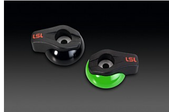
ГОНОЧНАЯ ЗАЩИТА РАМЫ (НАКЛАДКИ)