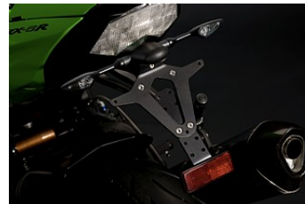
КОМПЛЕКТ ЗАДНИХ УКАЗАТЕЛЕЙ ПОВОРОТА