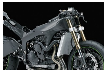
Оптимизация баланса шасси и централизации масс