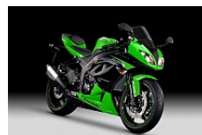
Lime Green / Metallic Spark Black