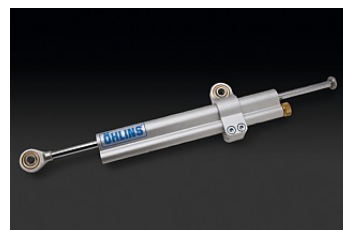
ДЕМПФЕР РУЛЕВОГО УПРАВЛЕНИЯ ÖHLINS