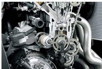
Увеличенная мощность на средних оборотах