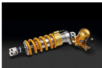
ЗАДНИЕ АМОРТИЗАТОРЫ ÖHLINS

На эти детали не распространяются условия гарантии Kawasaki