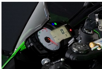
Новая панель приборов