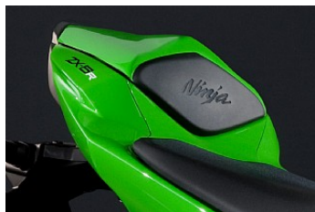
КРЫШКА ЗАДНЕГО СИДЕНЬЯ МОТОЦИКЛА