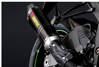
ВЫХЛОПНАЯ СИСТЕМА АКРАПОВИЧ*