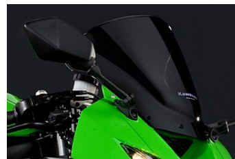
ВЕТРОВОЕ СТЕКЛО (тонируемое)