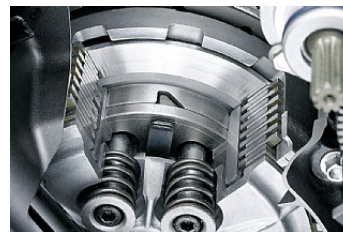
Сцепление с регулируемым ограничителем обратного крутящего момента