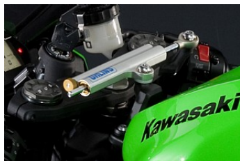
Рулевой демпфер Öhlins