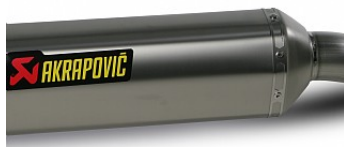
ГОНОЧНАЯ ВЫХЛОПНАЯ СИСТЕМА АКРАПОВИЧ