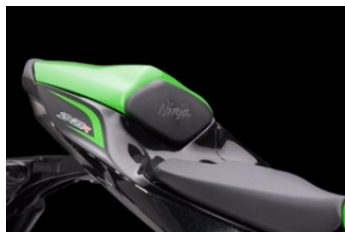
Кожух на сиденье