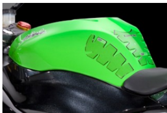
Наклейка на бензобак