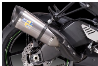
Выхлопная труба Leo Vince