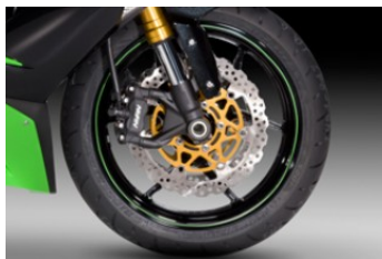
Наклейки на обода дисков