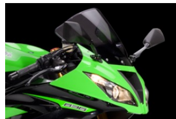
Высокое ветровое стекло