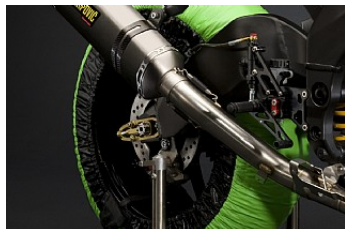
ПОДОГРЕВ КОЛЕС (80°C)

На эти детали не распространяются условия гарантии Kawasaki