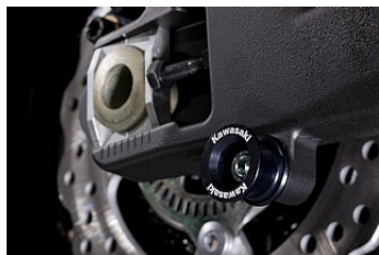
КОМПЛЕКТ ОПОРНЫХ РОЛИКОВ М8