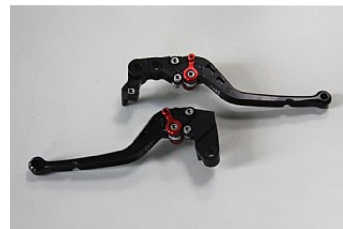
КОМПЛЕКТ РЕГУЛИРУЕМЫХ РЫЧАГОВ