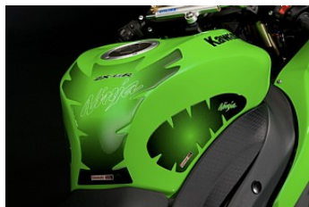
НАКЛЕЙКА НА БАК