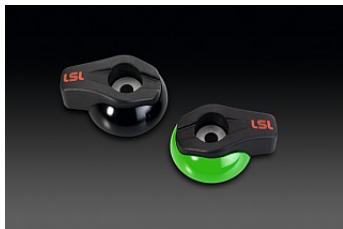
ГОНОЧНАЯ ЗАЩИТА РАМЫ (НАКЛАДКИ)