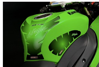
ЗАЩИТА УПОРА КОЛЕН