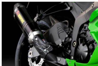
Выхлопная система Akrapovic