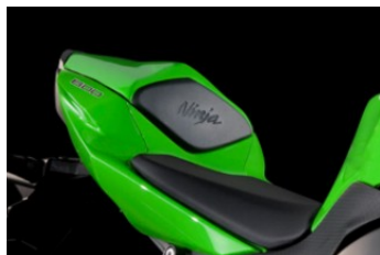
Кожух на сиденье