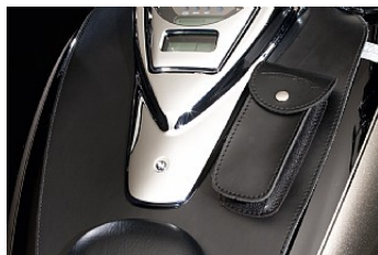
НАКЛАДКА БЕНЗОБАКА VN1700