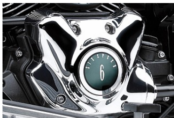
6-ступенчатая коробка с повышающей передачей