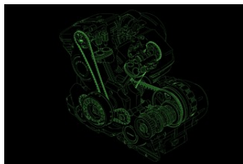
Мощный V-образный двигатель