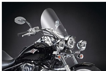
ВЕТРОВОЕ СТЕКЛО TOURING