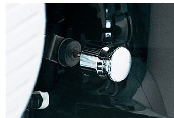
РЫЧАЖОК ВОЗДУШНОЙ ЗАСЛОНКИ - ХРОМ