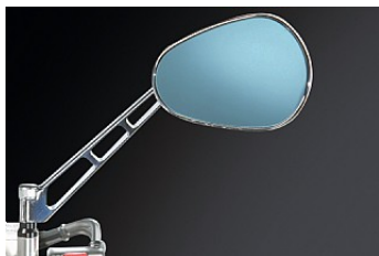
КОМПЛЕКТ СТОЕК ДЛЯ ЗЕРКАЛ