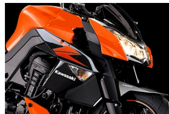
Агрессивный внешний облик