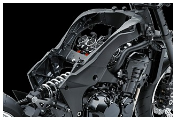
Новая алюминиевая рама