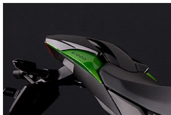
КРЫШКА ЗАДНЕГО СИДЕНЬЯ МОТОЦИКЛА