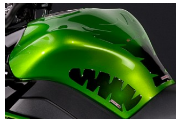
НАКЛАДКА ДЛЯ БЕНЗОБАКА