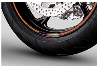
Новые 5-ти спицевые литые диски