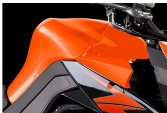
Стильный Топливный бак