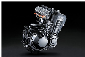
Полностью обновленный двигатель