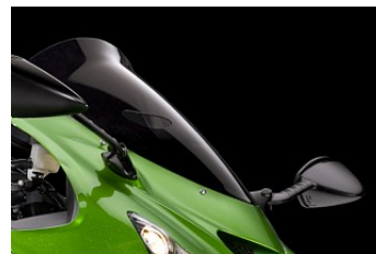
ВЕТРОВОЕ СТЕКЛО - СПОЙЛЕР