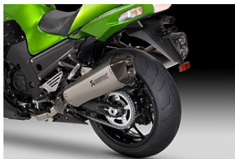
ДВОЙНАЯ ВЫХЛОПНАЯ СИСТЕМА АКРАРОВИС