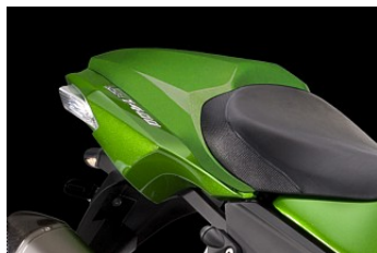
КРЫШКА ЗАДНЕГО СИДЕНЬЯ МОТОЦИКЛА